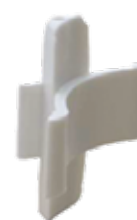
SBG 30 P