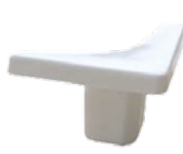
SBF 30 P