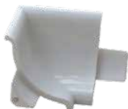
SBI 30 P