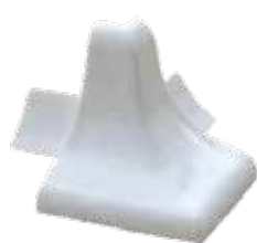
SBE 30 P